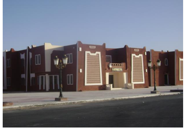
المنظر الخارجي لمركز الصناعة التقليدية بأدرار