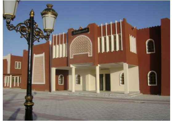
المنظر الداخلي لهيكل السوقة بأدرار.