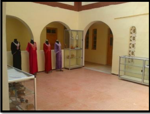
منظر داخلي لمركز الصناعة التقليدية بأدرار